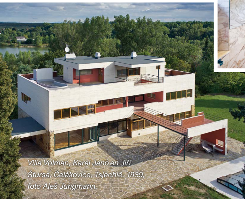
Villa Volman, Karel Jano en Jiří Štursa, Čelákovice, Tsjechië, 1939, foto Aleš Jungmann.