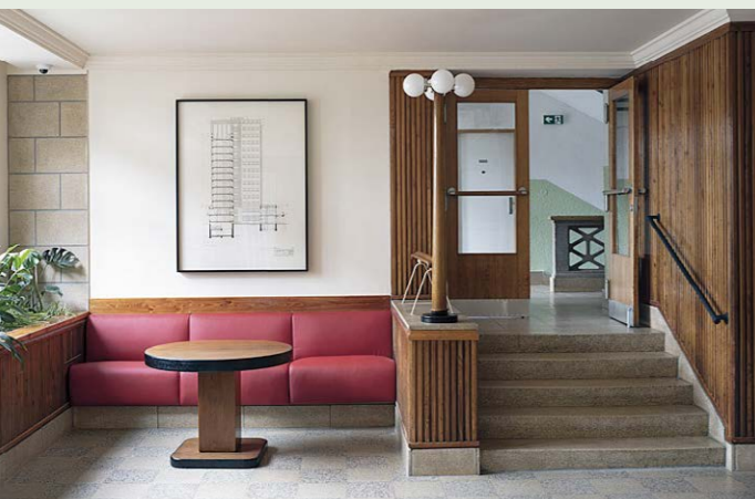
Museum van torenflats, Kladno, Tsjechië, 1956-57.

In de buurt van Praag is een Tsjechisch voorbeeld van sociale woningbouw te vinden: het Museum van torenflats in Kladno, ontworpen door Josef Havlíček (1899-1961). Havlíček was de hoofdarchitect van het ontwikkelingsplan voor de woonwijk Kladno-Rozděl. Hij was een van de meest prominente figuren van de interbellumavant-garde en hield zich naast architectuur ook bezig met meubelontwerp, beeldhouwkunst en schilderkunst. Hij hechtte belang aan betaalbare woningen voor de economisch zwakkeren en droeg met zijn ontwerpen bij aan een oplossing voor sociale en collectieve huisvesting. Naast de originele architectonische expressie, het luxe materiaalgebruik en de ruimtelijkheid is er tot in het kleinste detail nagedacht over het interieur.