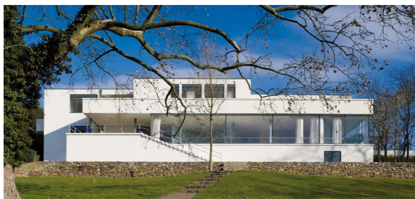
Villa Tugendhat in Brno, foto David Zidlicky.